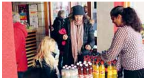
Boissons et pop-corn attendent les participants à l'entrée du Cinématographe le 17 décembre dernier.

Cette initiative signée du groupe TCS Juniors Romandie a permis au garçon de 15 ans de recevoir le premier prix, soit un bon de 500 fr.