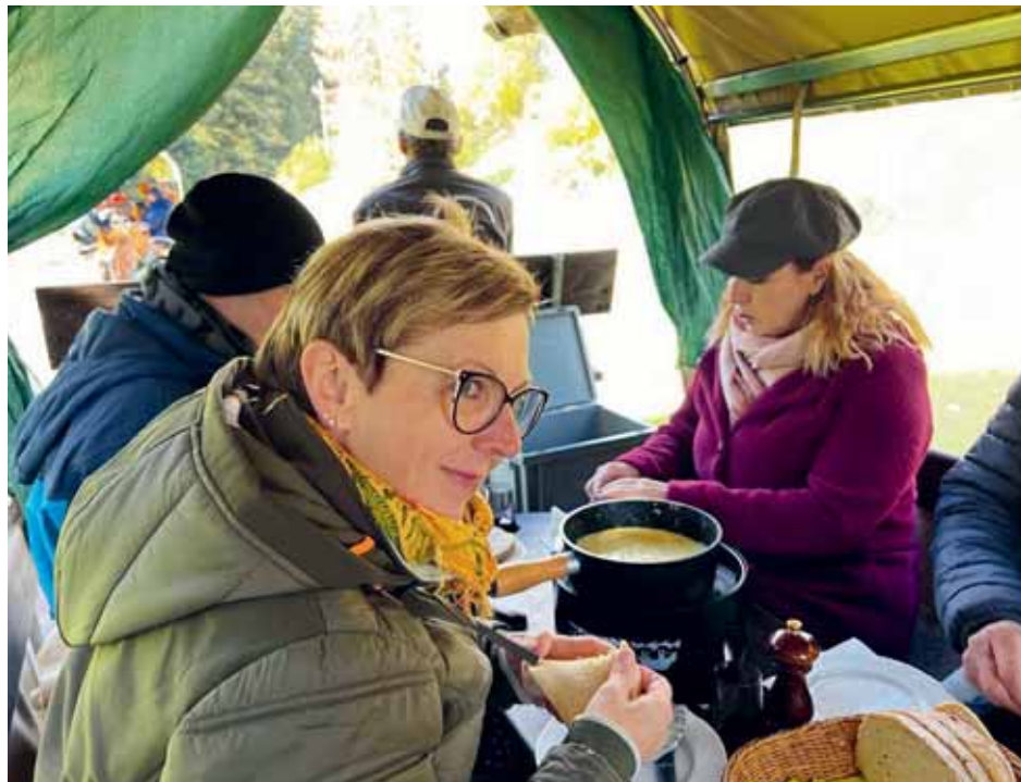
Lors de la balade dans les chars à fondue dans un décor splendide, la bonne humeur était au rendez-vous.