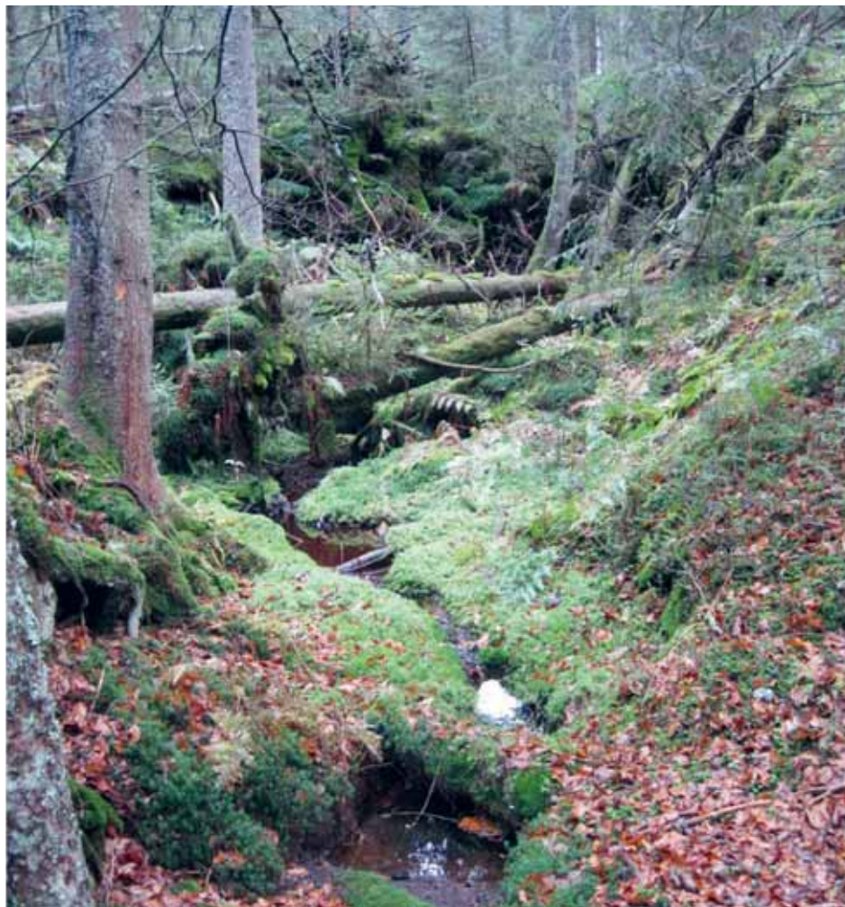
But de l'action tourbière: neutraliser les drains (sortes de ruisseaux bien visibles ici) par la réalisation de digues en argile. La tourbe sera ainsi à nouveau immergée et sa dégradation prévenue.

- Le transport s'effectuera en train jusqu'à la gare de Saignelégier (point de ralliement).